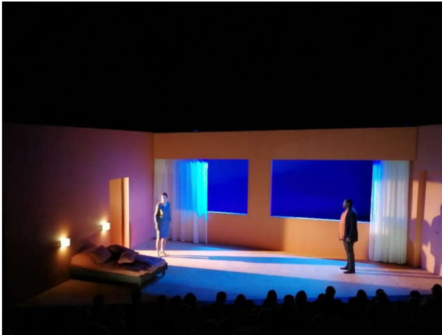
Bérénice de Jean Racine, m.e.s. Muriel Mayette-Holtz