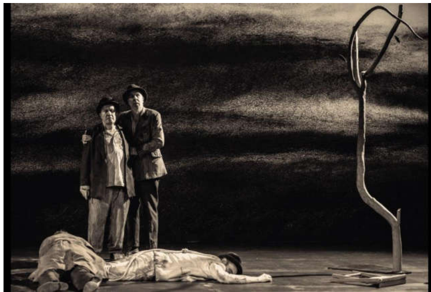
En attendant Godot de Samuel Beckett, m.e.s. Alain Françon.